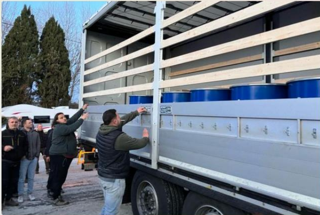
Les apiculteurs ont intercepté un camion de miel en provenance d'Ukraine. ● © Christian Mathieu / FTV

Le 27.01.2024 sur un blocage de Salon-de-Provence, les apiculteurs ont intercepté un camion transportant du miel en provenance d'Ukraine.