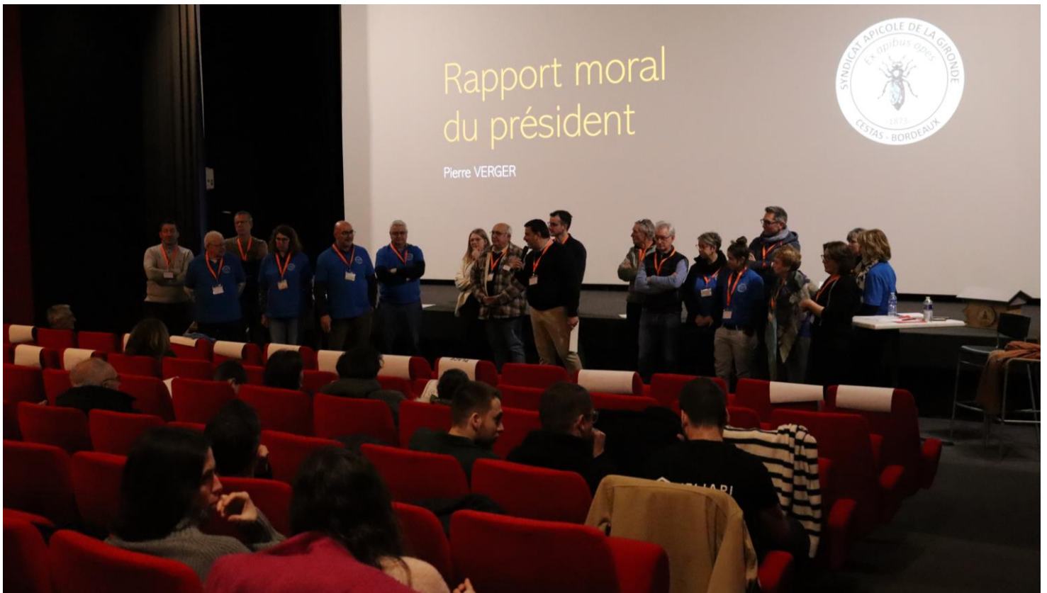
L'équipe du Conseil d'Administration presque au complet