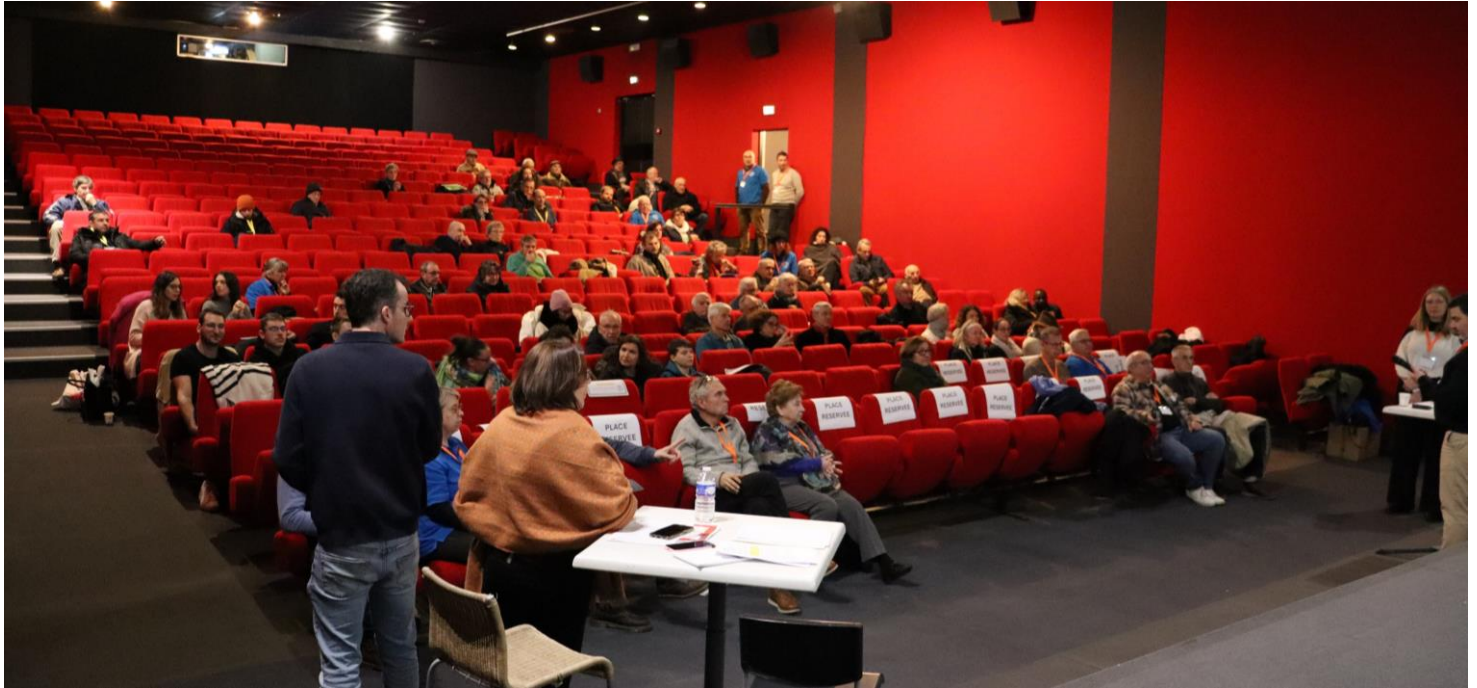
Les participants s'installent dans la belle salle du cinéma REX de Cestas