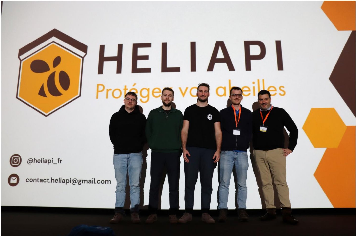
L'équipe HELIAPI et les présidents du Rucher école et du SAG