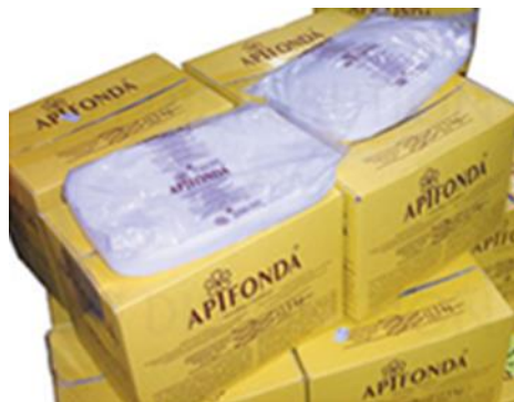
Candi APIFONDA Sachet de 2,5kg