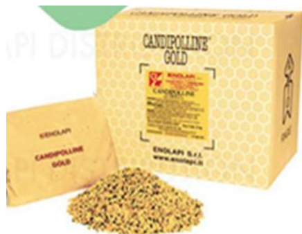
CANDIPOLLINE Gold Sachet de 1kg

au lieu de 5,80 € TTC prix public constaté